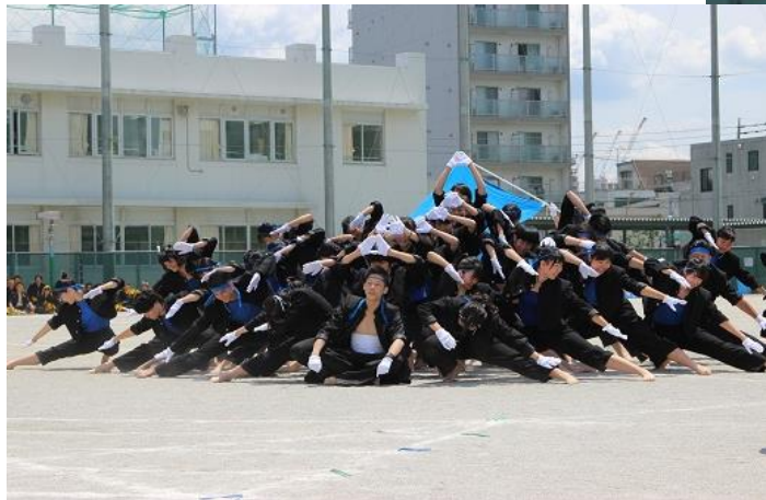
体育祭応援団（赤団）