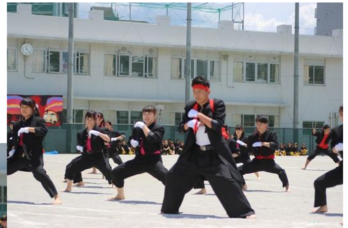
体育祭応援団（赤団）