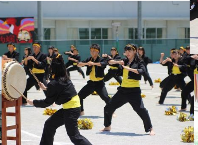
体育祭応援団（赤団）